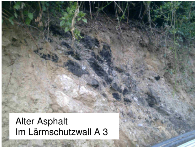
Alter Asphalt Im Lärmschutzwall A 3

Lärmschutzwall an A 3 ohne Genehmigung als Deponie für Asphalt und Müll genutzt.