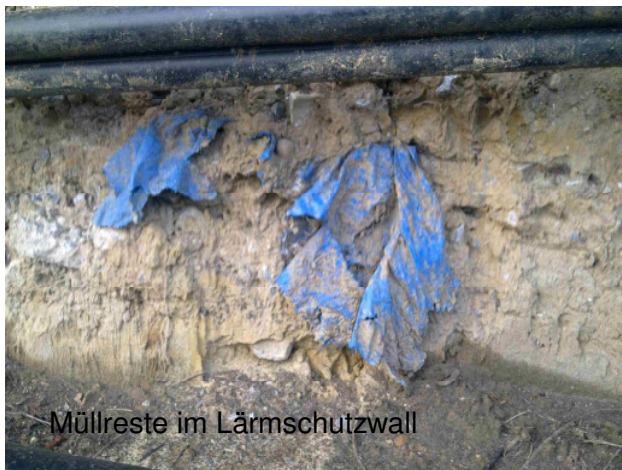
Müllreste im Lärmschutzwall

Die Information im Umweltausschuss 1985 war also falsch .